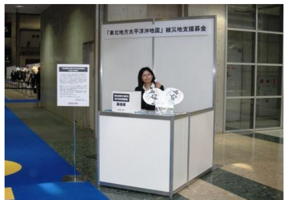
主催者による 被災地支援募金ブースの設置