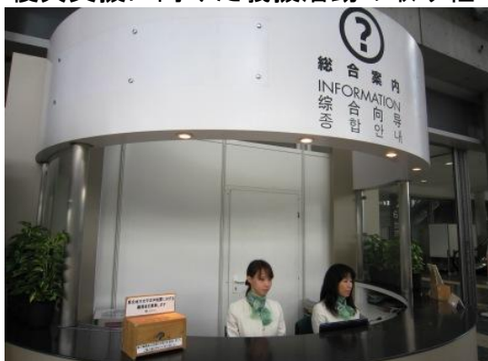
総合案内に義援金箱を設置