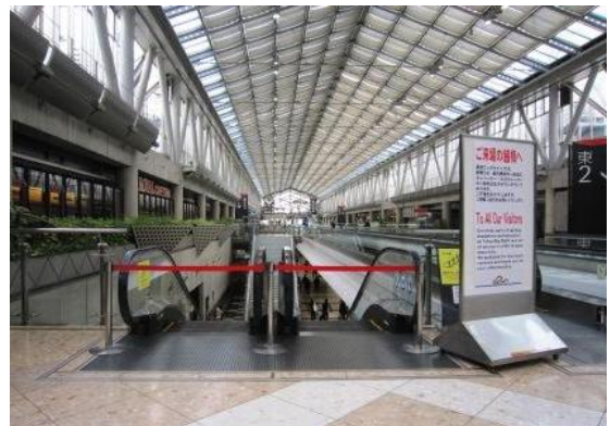
エスカレーターの部分停止