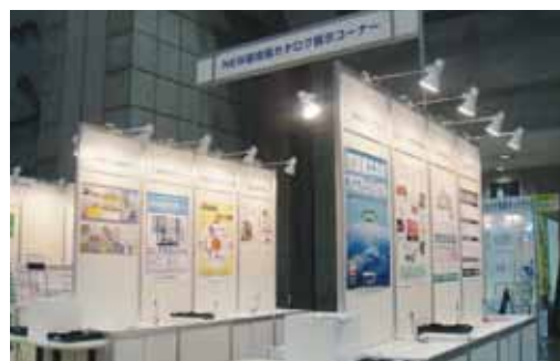
NEW環境展、地球温暖化防止展カタログ展示コーナー風景